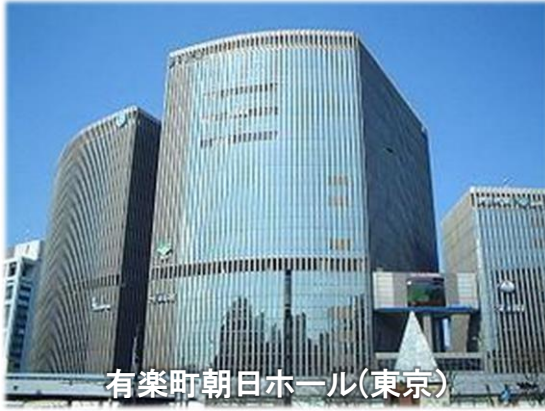
有楽町朝日ホール(東京)